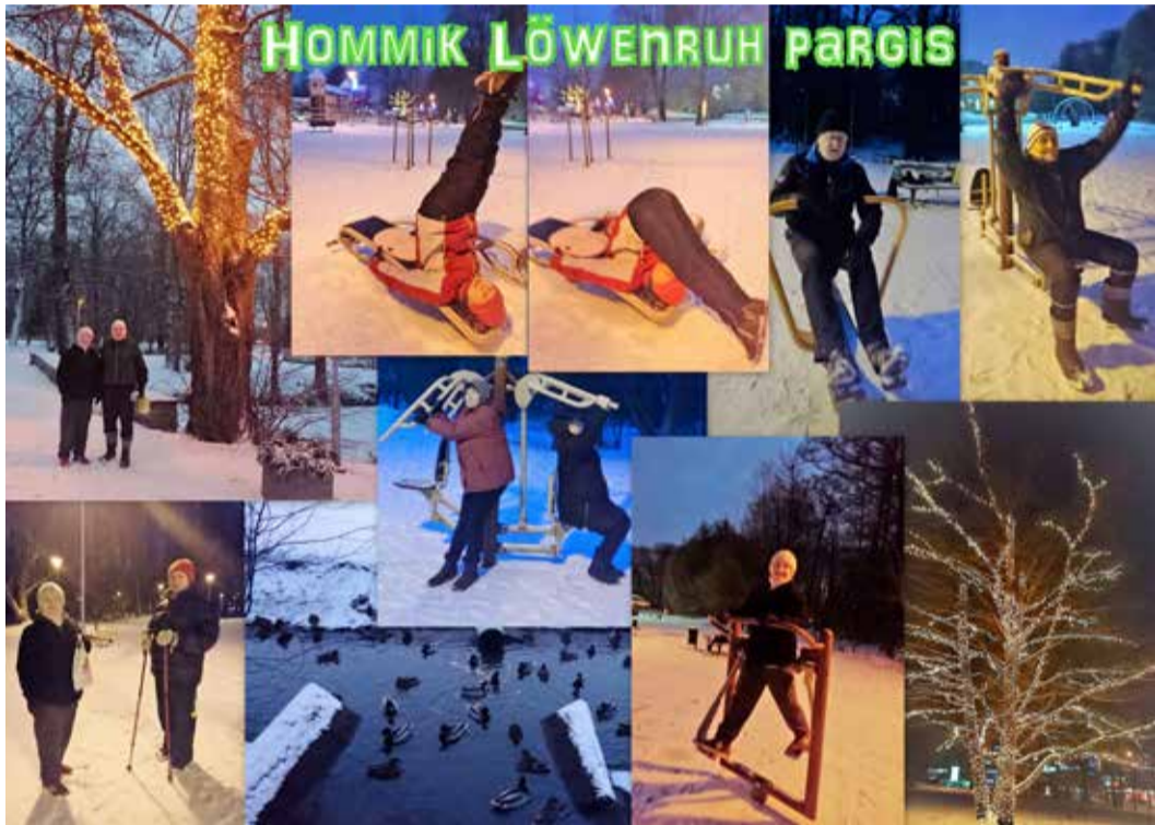
Talvehommik Löwenruh' pargis. Osa meie tublist võimlemisrühmast. Ja pisut silmailu.

26.03 kell 12.00 „MAA ILU“ (2006, Prantsusmaa)